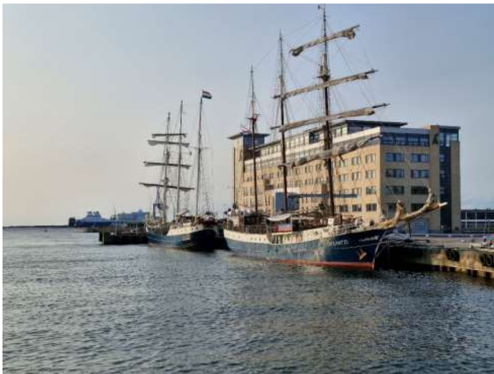
Krankajen juni – Tall Ship's Atlantis och systerfartyget Antiqua.