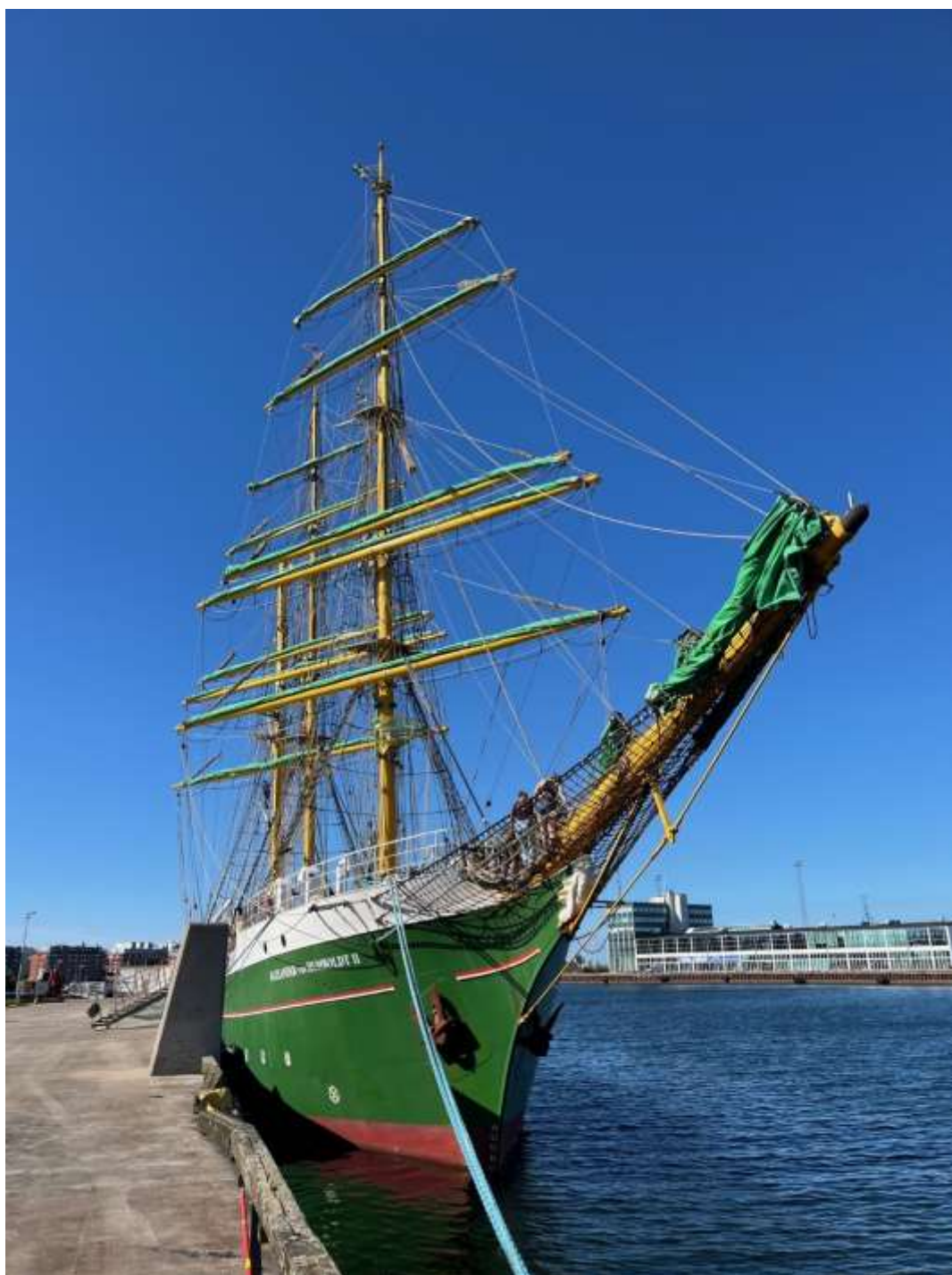
Alexander Von Humboldt II

På Smörkajen låg Skonaren Clipper DJS Albatros och barken Alexander Von Humboldt II fick kajplats i Nyhamnen. Den senare är ett relativt modernt fartyg byggd 2011 – men i gammal stil.