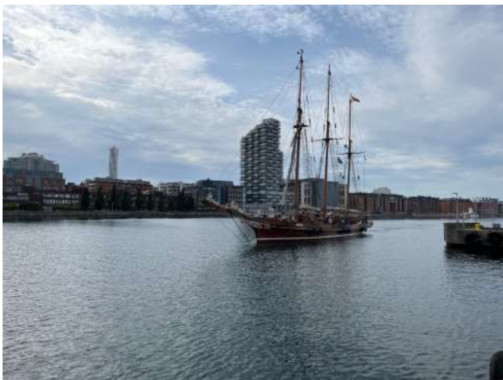
Skonaren Amphitrite – från Tyskland – med flera besök under 2025

Några av de fartyg som erbjudits plats är: