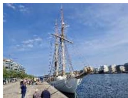
HMS Gladan på besök vid Sundskajen – Limhamn våren 2025

Vi har under 2025 arrenderat ut platser till två privata större yachter där den ena avgick till USA under