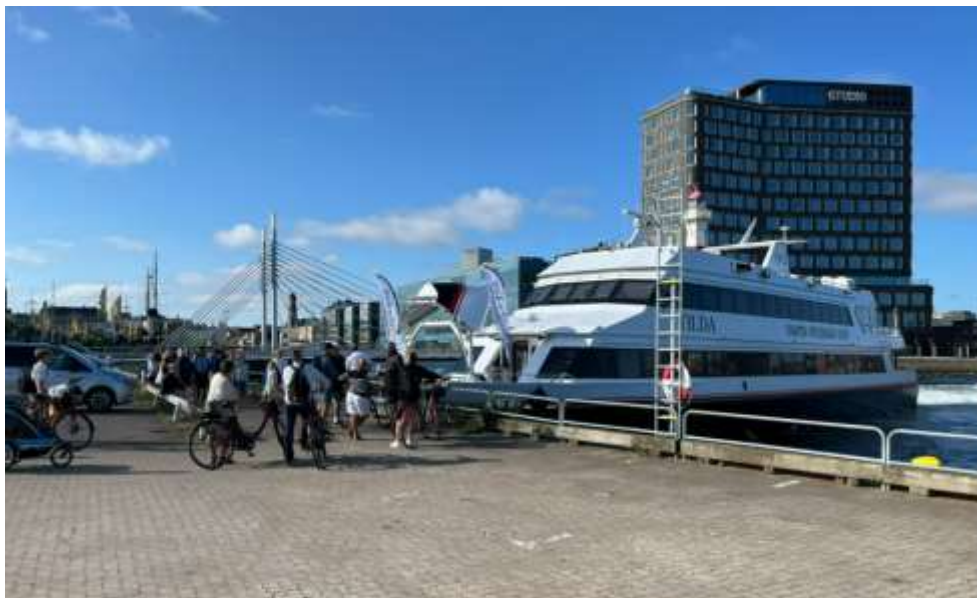
M/S Tilda med trafik till Ven

båtturer med räkfrossa och musikuppträde under valda dagar utanför säsong.